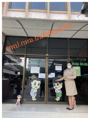
นางสาวชุตีมา ฝั่งพัฒน์ สพ.กทม. ยินดีต้อนรับค่ะ